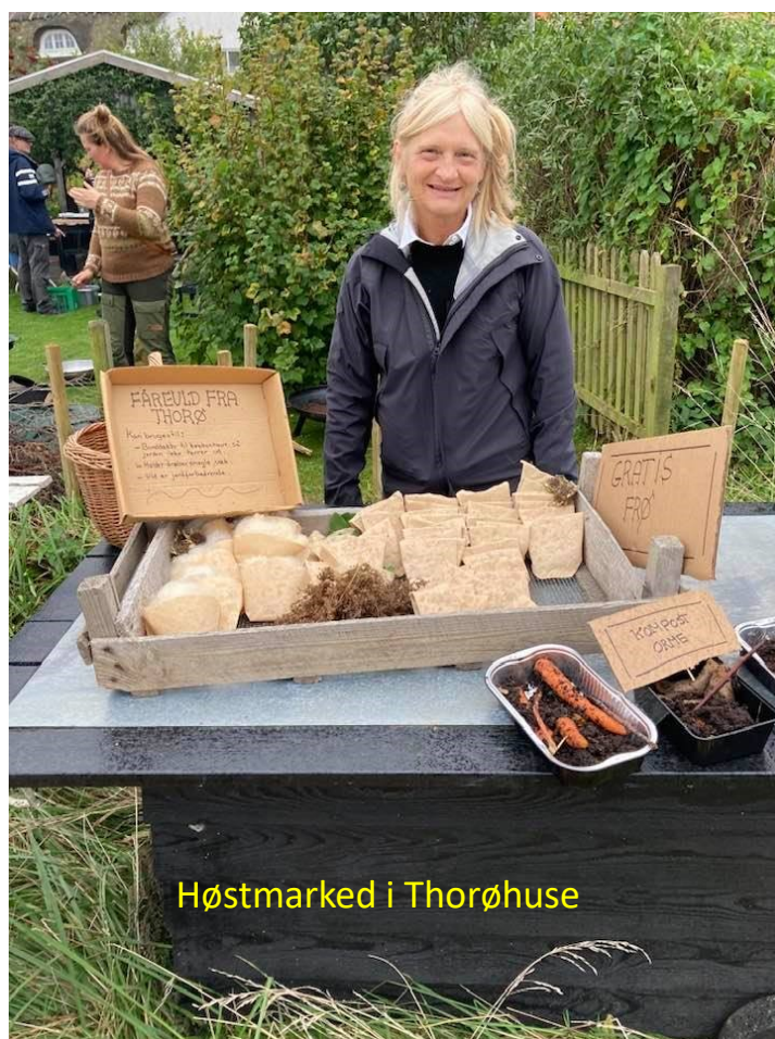
Høstmarked i Thorøhuse